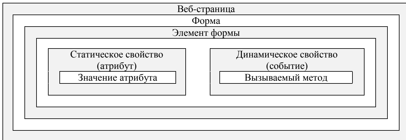
Рис. 1. Применение объектно-ориентированного подхода к формам веб-страниц

статическому свойству (атрибуту) или динамическому свойству (событию) с последующим выбором или установки значения атрибута или активации соответствующего метода в виде, как правило, указания имени вызываемой функции обработчика данных формы.