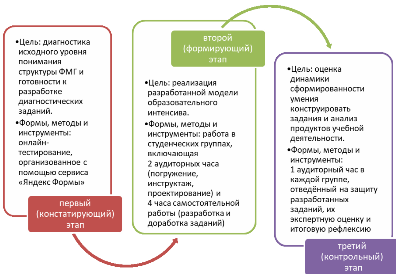
Рис. 1. Этапы пилотного педагогического эксперимента

Пилотный педагогический эксперимент проводился в 2025–2026 учебном году и включал три последовательных этапа (рис. 1). Выборку исследования составили студенты 3 курса (очного и заочного отделений) математического факультета ПГГПУ.